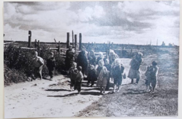
ище родного Ульяновский е название -